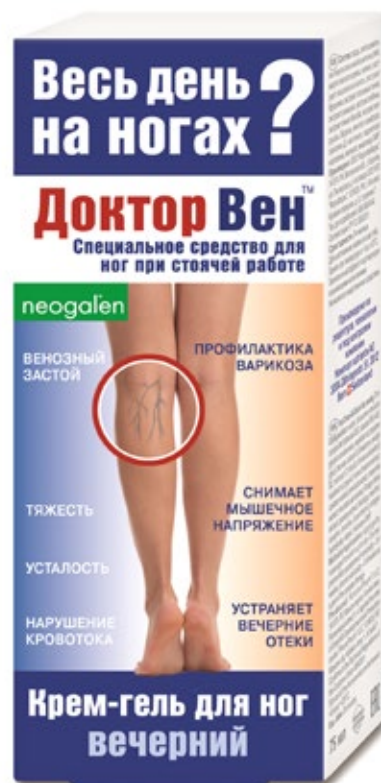
Вечерний крем-гель 75 мл

При наследственной предрасположенности к варикозу