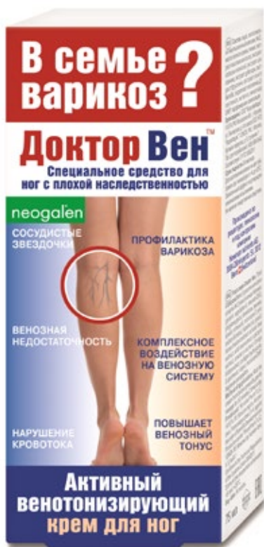
Венотонизирующий крем 75 мл